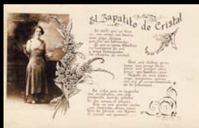
Com. In. Fot. prop. aseg., el número y el año.