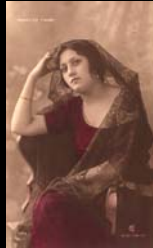
La marca, registrado, el número y el nombre del artista