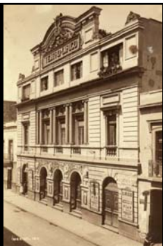
Teatro Lírico, Cd. de México

Empresarios teatrales y alquiladores de cine