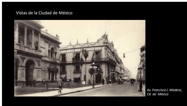
Vistas de la Ciudad de México