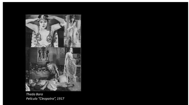
Theda Bara Película "Cleopatra", 1917