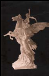
La marca con el número de fotografía