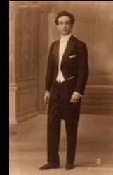
La marca, el número, prop. aseg. y el año