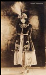
La marca, el nombre de la artista y el número de la fotografía