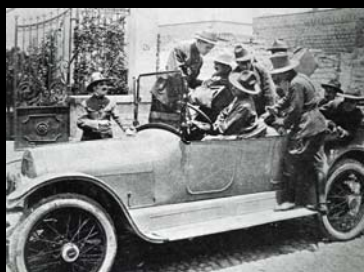
Película "El Automóvil Gris", 1919