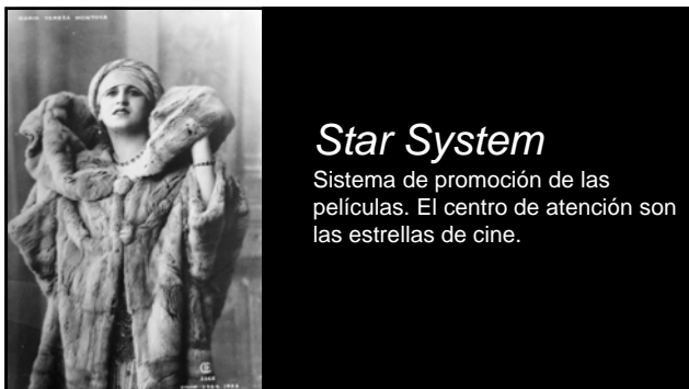
Star System Sistema de promoción de las películas. El centro de atención son las estrellas de cine.