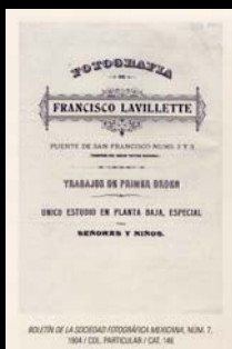
Francisco Lavillette tuvo un estudio en el puente de San Francisco Números. 2 y 3