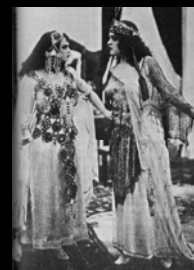
Mimi Derba Película "En defensa propia", 1917